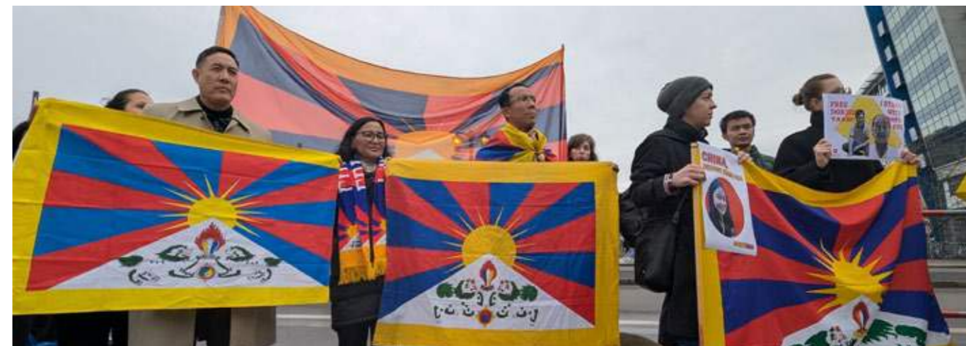
Protest vor der chinesischen Botschaft: Jeder politische Gefangene ist ein Fall zu viel.