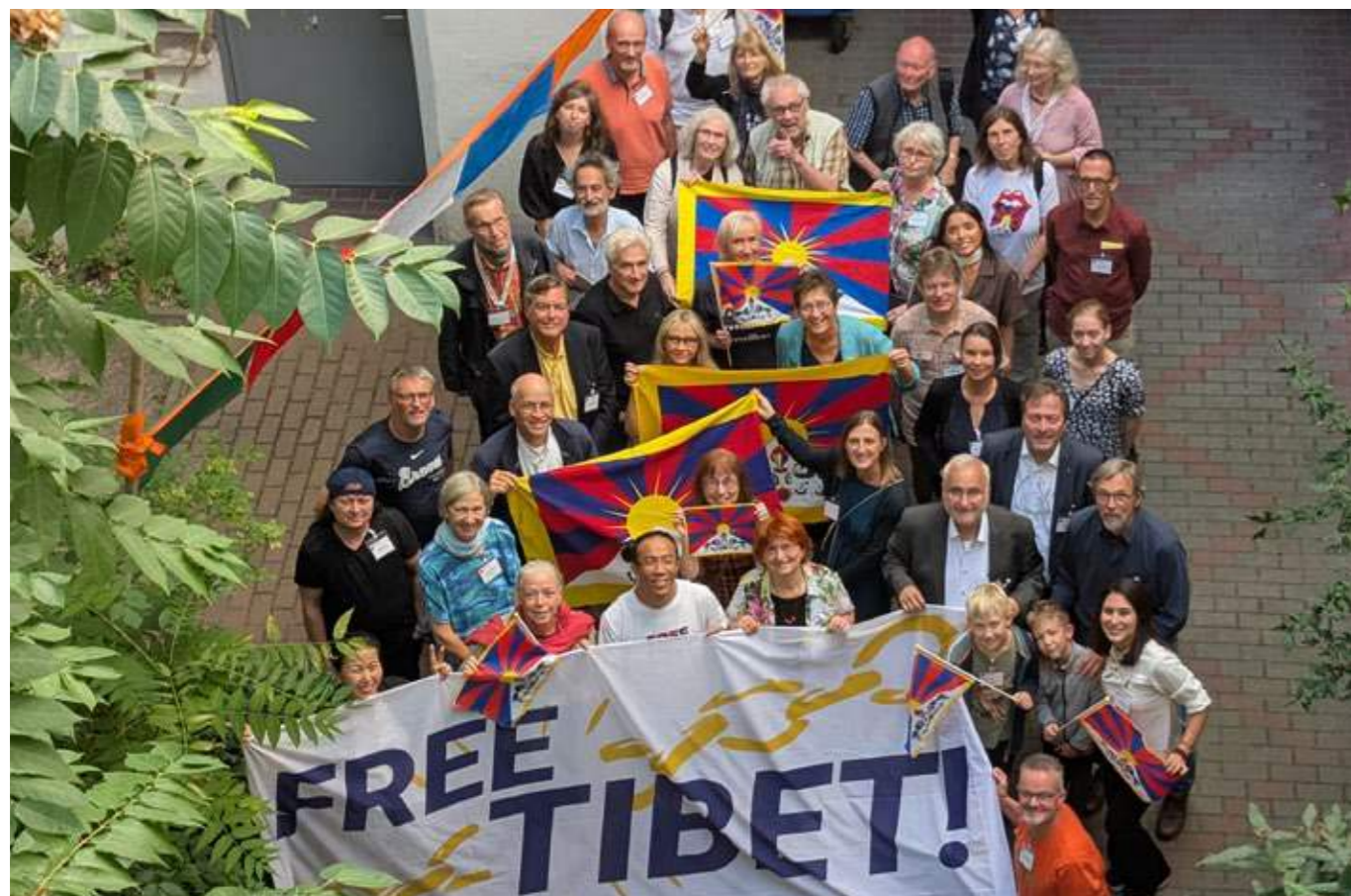
Mitglieder der Tibet Initiative bei der jährlichen Mitgliederversammlung 2025