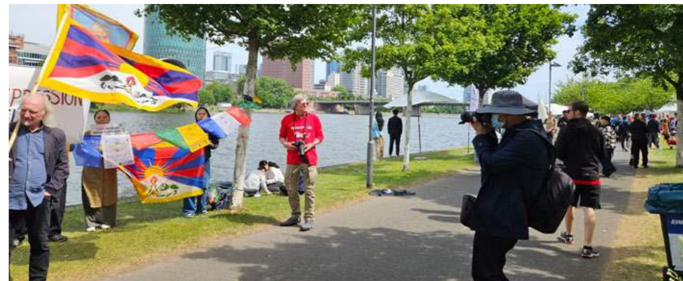
Die Demonstrierenden wurden über den ganzen Tag immer wieder fotografiert und bedrängt.

Das Festival wurde unter Mitwirkung chinesischer Staatsorgane mit Nähe zur chinesischen Einheitsfront, einem Instrument staatlicher Einflussnahme und Propaganda, organisiert. Der Vorfall wirft erneut ein Schlaglicht auf die Versuche der chinesischen Regierung, auch im Ausland kritische Stimmen zum Schweigen zu bringen, und unterstreicht die Notwendigkeit, demokratische Grundrechte entschlossen zu schützen.