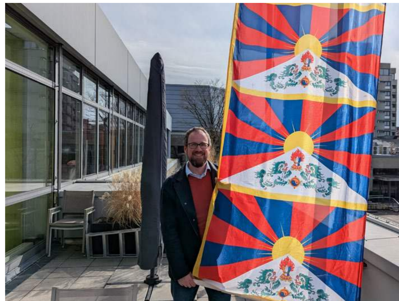
Über 410 Kommunen beteiligten sich 2025 – darunter Erlangen mit besonderem Flaggendesign.