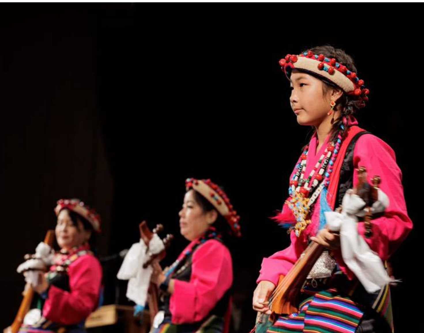
Die Tibetische Gemeinschaft in Deutschland präsentierte ein buntes und vielfältiges Kulturprogramm: Musik- und Tanzbeiträge trugen zur festlichen Stimmung bei.