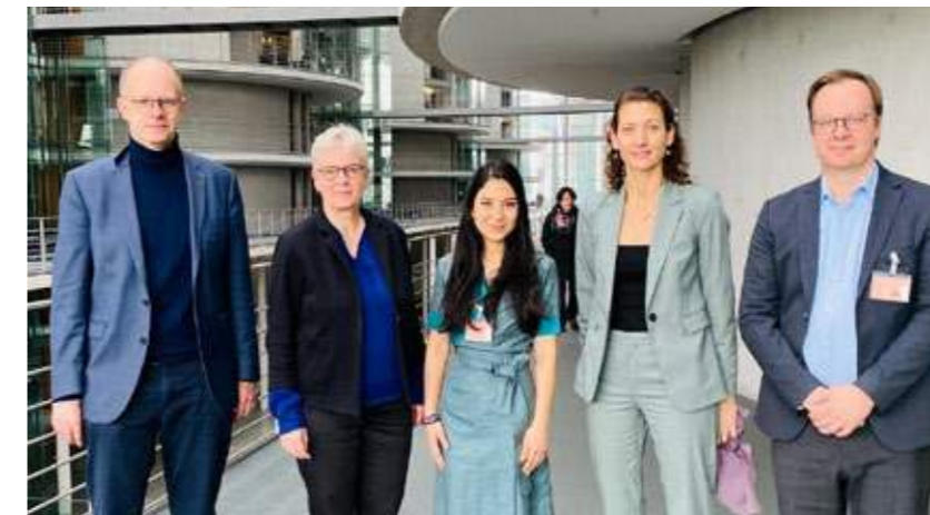
Austausch mit den Mitgliedern der Tibet-Parlamentsgruppe über die Zwangsinternate in Tibet.

betriebenen Internaten untergebracht. Dies führt dazu, dass die tibetischen Kinder ihre Muttersprache verlieren und die Fähigkeit, sich mit ihren Eltern und Großeltern auf Tibetisch zu verständigen, beeinträchtigt wird, was zur Erosion ihrer Identität und Assimilierung an die chinesische Kultur führt. Zudem wurden ländliche Schulen in Tibet geschlossen und durch Schulen auf Stadt- oder Kreisebene ersetzt, in denen die Kommunikation fast ausschließlich in Mandarin stattfindet und kaum Gelegenheit besteht, etwas über die tibetische Sprache, Geschichte und Kultur zu lernen. Die UN-Expert*innen stellten auch fest, dass Initiativen zur Förderung der tibetischen Sprache und Kultur unterdrückt und Personen, die sich für die tibetische Sprache und Bildung einsetzen, verfolgt werden.