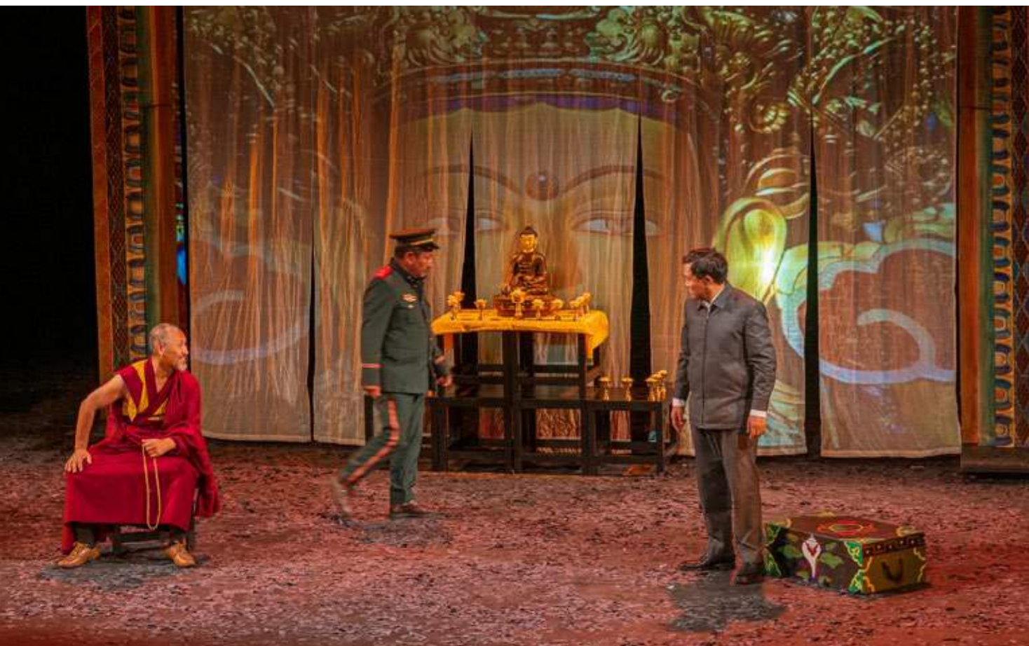
Das Theaterstück Pah-Lak begeisterte deutschlandweit das Publikum.

Ein entscheidender Faktor für den Erfolg der Kampagne war die engagierte Unterstützung durch Regionalgruppen, Kontaktstellen und Aktive. Sie organisierten Infostände, Mahnwachen und Kundgebungen, um die Bevölkerung über die Lage in Tibet aufzuklären und das Bewusstsein für die dringende Notwendigkeit von Veränderungen zu schärfen. Besonders erfreulich war die Beteiligung vieler Bürgermeister*innen an den Aktivitäten vor Ort.