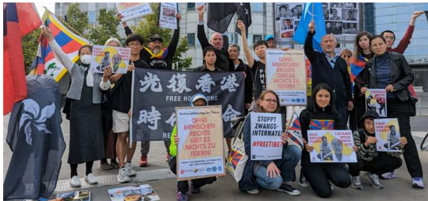
Gemeinsamer Demonstration in Berlin gegen die Menschenrechtsverletzungen in Tibet, Ost-Turkestan, Hongkong und China.

Sie demonstriert seit Anfang des Jahres immer wieder friedlich vor dem Obersten Gerichtshof in Lhasa für das Recht, ihren Bruder im Gefängnis besuchen zu dürfen. Sie wurde daraufhin mehrfach verhaftet und körperlich misshandelt.