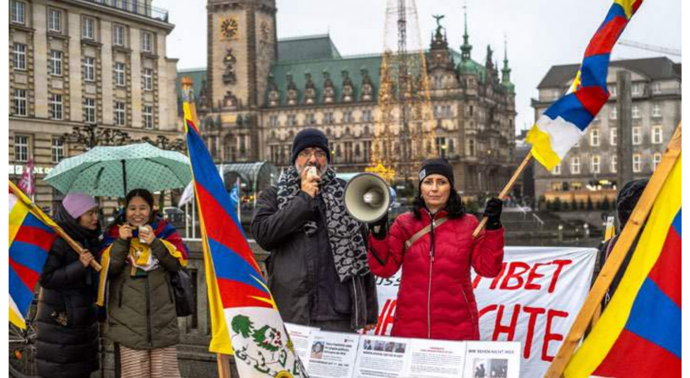
Protestaktion der Regionalgruppe Hamburg zum Internationalen Tag der Menschenrechte.

Unsere kontinuierlichen öffentlichen Protestaktionen seit dem letzten Jahr richten sich nicht nur an politische Entscheidungsträger*innen, sondern auch an Wirtschaftsführer*innen mit der klaren Forderung: Wirtschaftliche Beziehungen müssen stets im Einklang mit den Menschenrechten stehen.