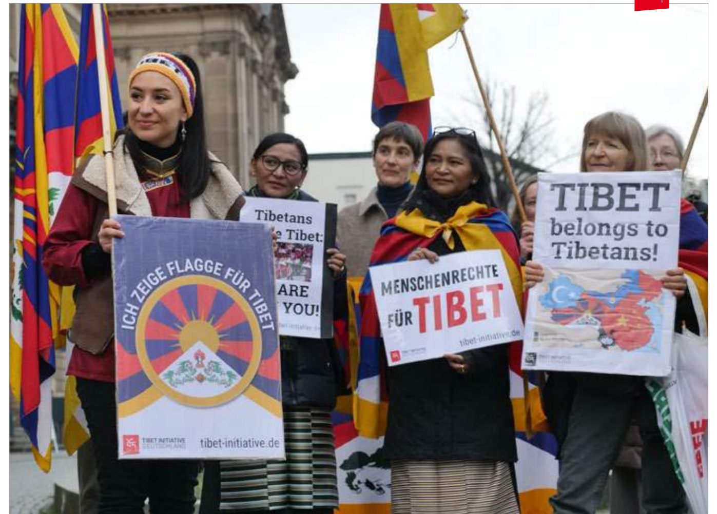
Teilnehmerinnen bei der Flaggenhissung vor dem Rathaus in Potsdam.

Vorstand der Tibet Initiative Deutschland e. V.