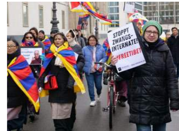
Demoumzug in Berlin.