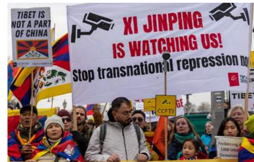
Protest vor der Chinesischen Botschaft in Berlin mit Dummy-Überwachungskameras.

Unser Ziel ist es, die Vielschichtigkeit der Repression aufzuzeigen und in einen Dialog mit politischen Entscheidungsträger*innen zu treten. Durch die Veröffentlichung dieses Briefings machen wir den ersten Schritt, um die Aufmerksamkeit auf diese anhaltende, subtile und tief verwurzelte Strategie zu lenken. Gleichzeitig suchen wir den Austausch mit der tibetischen Gemeinschaft, um Fälle zu dokumentieren und zukünftig Unterstützung sowie Aufklärung anzubieten. Wir streben nach einem politischen Umdenken gegenüber dem Auftreten Chinas und arbeiten darauf hin, dass alle Tibeter*innen und Dissident*innen im Ausland frei und sicher leben können, ohne Furcht und Selbstzensur.