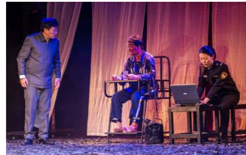
Szenen aus dem Theaterstück.