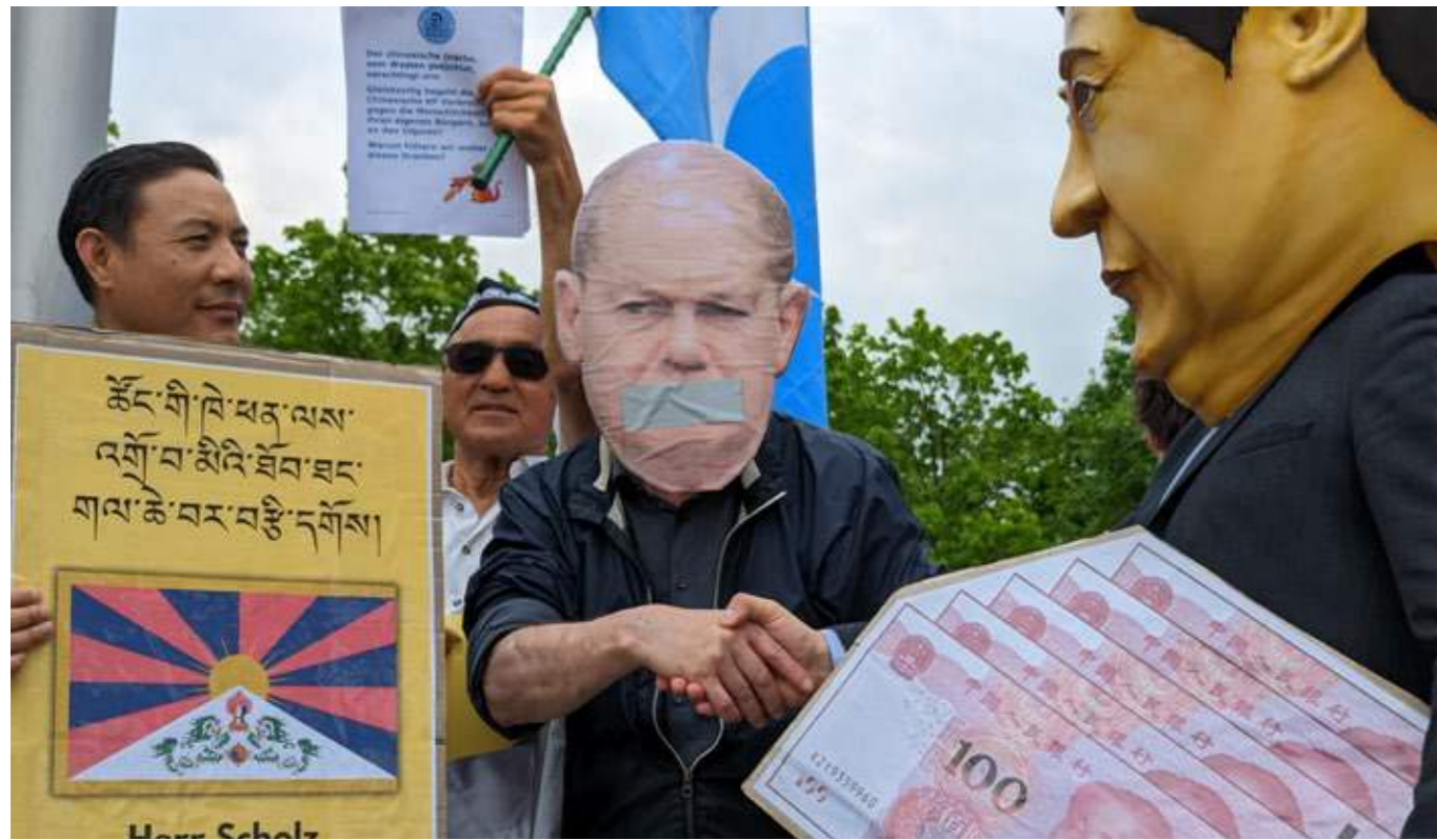
Protest während der Regierungskonsultationen vor dem Kanzleramt in Berlin.