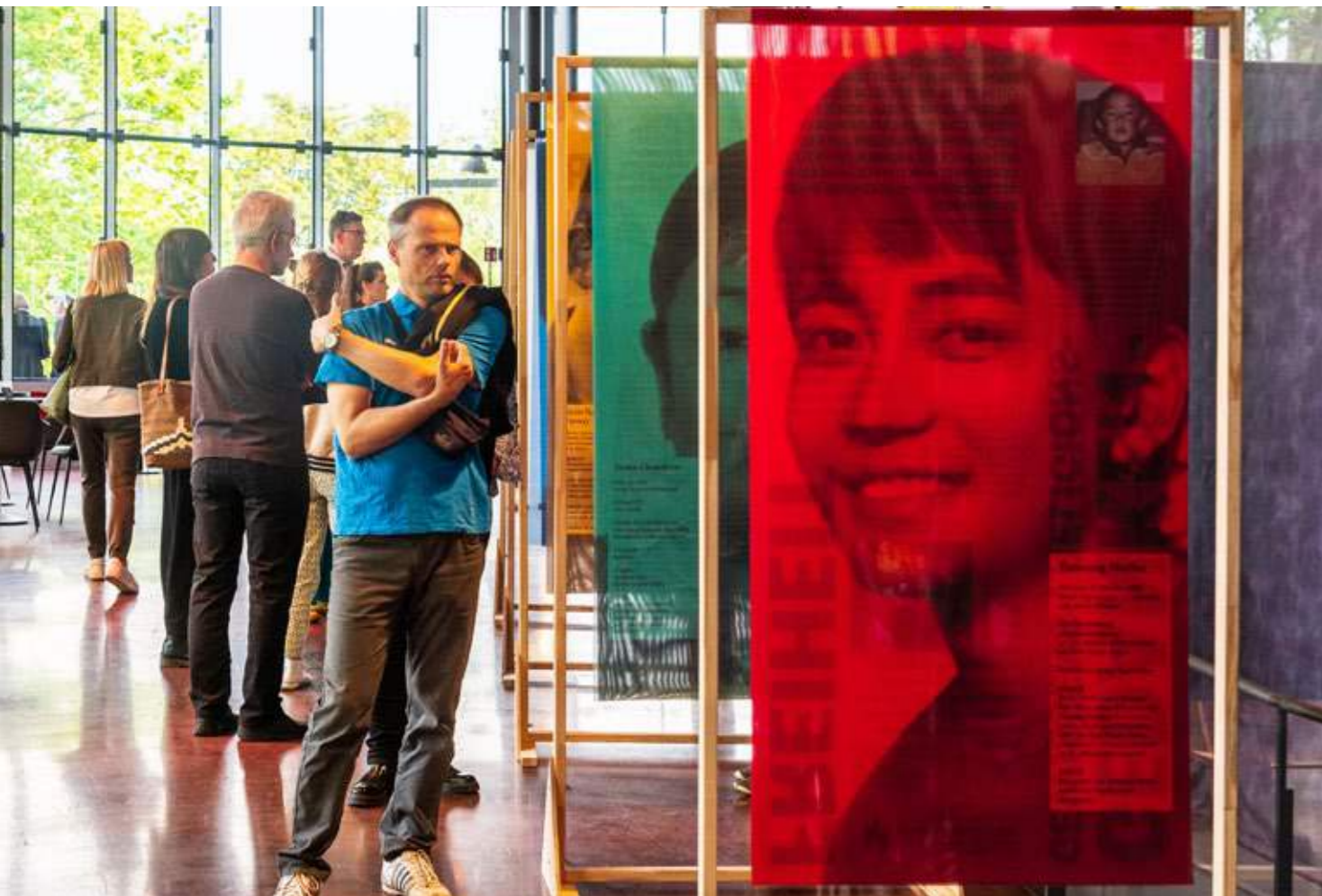
Die Ausstellung begleitete „Pah-Lak“ auf der Europa-Tournee, hier zu sehen im Foyer des Hans-Otto-Theaters in Potsdam.