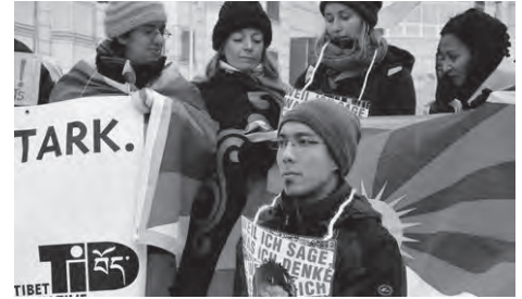
Tag der Menschenrechte