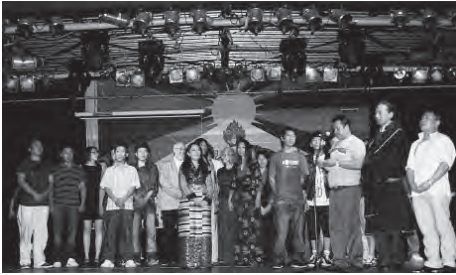
Tibet-Fest in München